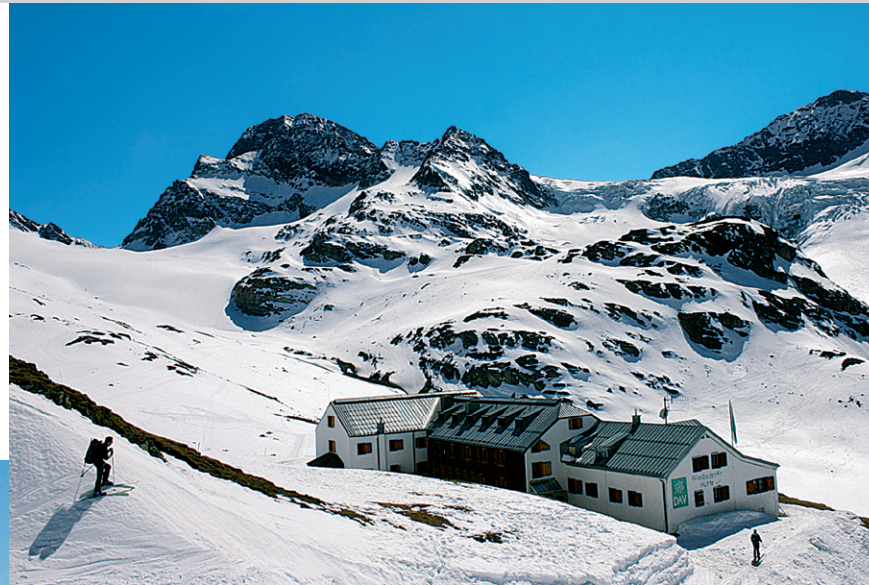
Die Wiesbadener Hütte mit Piz Buin und Ochsentaler Gletscher.

Talort: Partenen, 1051 m, im Talschluss des Montafon, am Beginn der im Winter gesperrten Silvrettastraße.