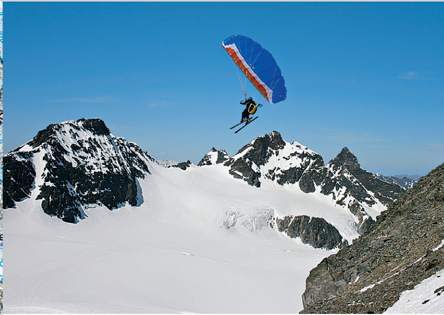
Nur Fliegen ist schöner, aber schade um die Skiabfahrt. Unter dem Paraglider das Silvrettahorn.

Wie bei Tour 46 zur Wiesbadener Hütte . Ab hier Richtung Vermuntgletscher, dann unterhalb des Gletschers nach rechts in den Sattel südlich der Grünen Kuppe (2579 m) und auf den Ochsentaler Gletscher . Mit wenigen Metern Höhengewinn quert man den gesamten Gletscher bis in den spaltenärmsten Bereich unterhalb der steilen Ostwände des Silvrettahorns. Am Fuße der Abbrüche erst in südlicher, dann sehr flach in südöstlicher Richtung in die Buinlücke (3054 m) zwischen Großem und Kleinem Piz Buin (Ski-depot). Über den ersten Steilhang zu einer kleinen Stufe, dann in leichter Kletterei zu einem steilen und ausgesetzten Kamin. Oberhalb davon wird das Gelände wieder flacher und zuletzt erreicht man über den Nordwestrücken den für seinen Ausblick bekannten Gipfel.